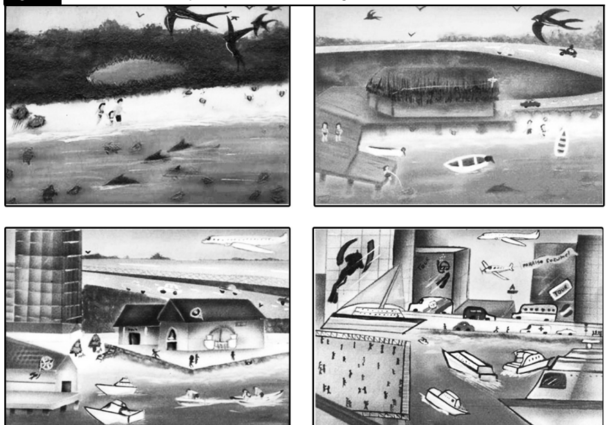
Figura 1. Límites de Cambio Aceptable del Área Natural Protegida.